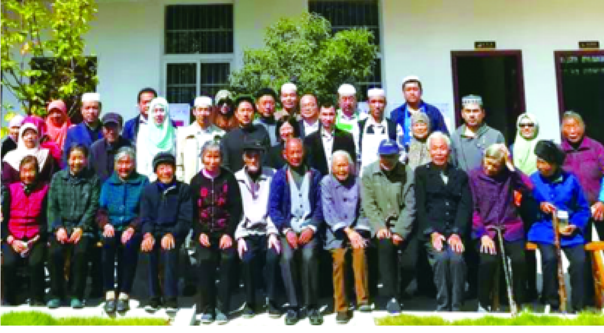
回族志愿者与常山老人合影

本报讯(通讯员 钱李源 黄珍珍 祝雅斌)10月18日,《浙江日报》刊发了《常山招贤镇村民共庆佳节一碗面温暖人心》一文,讲述回族志愿者与常山老人一起共度重阳佳节,共话民族一家亲的故事。